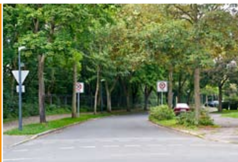
„Über den Knöchel“: Ab hier wandelt sich die Beethovenstraße in eine Allee.

Tode gequält von zahlreichen Klavierschülern und Telefonwarteschleifen bis zu den großen Symphonien. Beethoven gilt in der Musikgeschichte heute als Höhepunkt der sog. Wiener Klassik. Er hat die für diese Epoche grundlegenden Formen der Symphonie, der Klaviersonate und des Streichquartetts zur Vollendung gebracht. In der ersten Periode seines Schaffens schloss er sich noch aufs engste an Haydn und Mozart an, bis er zu seinem ganz eigenen Stil fand. Was ihn nun vor diesen, ihrerseits nicht ganz unbedeutenden Vorgängern auszeichnet, ist zunächst die weitere Ausgestaltung der übernommenen Formen zu größeren Zusammenhängen. Klassisch bestand die Symphonie aus vier Sätzen. Wichtigster Satz ist der erste, der sog. Kopfsatz, der meist mit einer evtl. langsamen Einleitung beginnt und zwei gegensätzliche Themen (Hauptthema und Seitenthema)