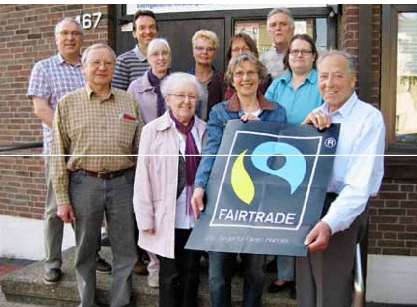
Bild links: Die Mitglieder der Steuerungsgruppe zur erfolgreichen Bewerbung der Stadt Herten

Was hat Herten mit London, Paris, Madrid, Kopenhagen, München und Dortmund gemeinsam? Richtig! Sie alle sind „Fairtrade-Town“, also Städte, in denen fair gehandelte Produkte verstärkt angeboten werden.