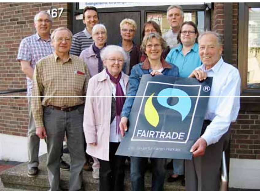
Bild links: Die Mitglieder der Steuerungsgruppe zur erfolgreichen Bewerbung der Stadt Herten

Was hat Herten mit London, Paris, Madrid, Kopenhagen, München und Dortmund gemeinsam? Richtig! Sie alle sind „Fairtrade-Town“, also Städte, in denen fair gehandelte Produkte verstärkt angeboten werden.